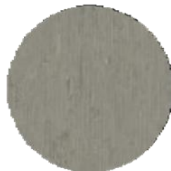
Lineárisan struktúrált felület